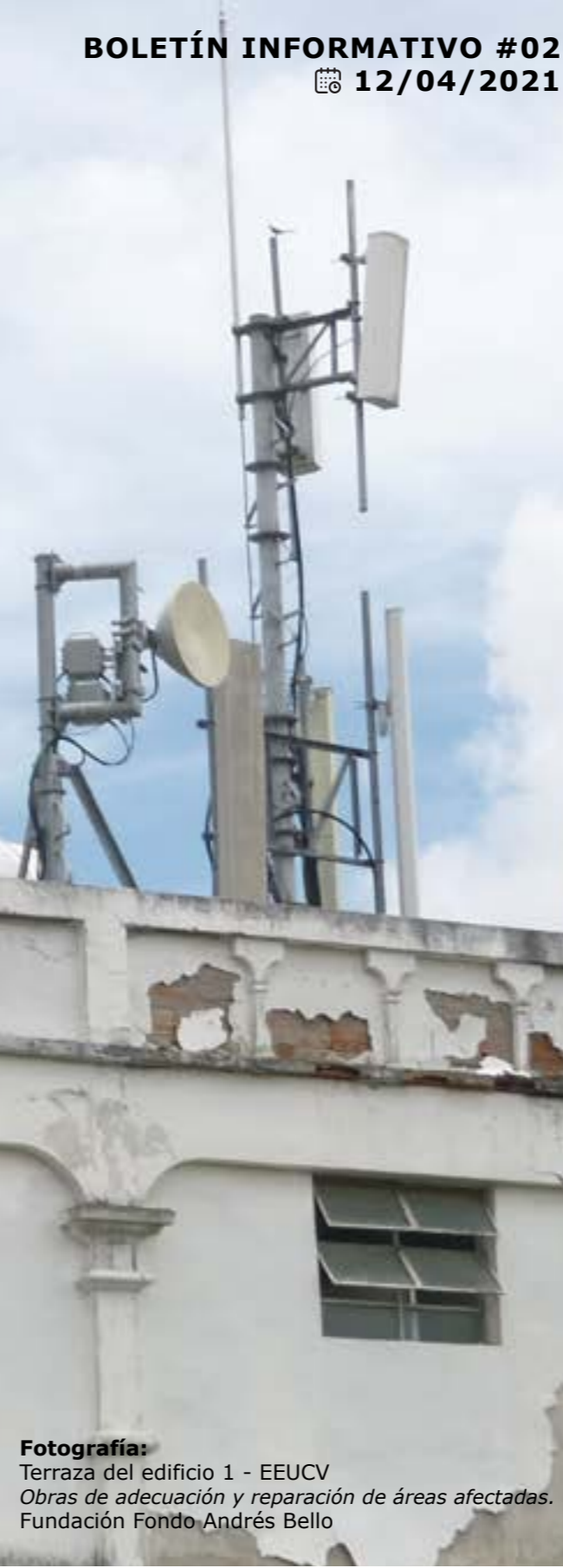
Fotografía: Terraza del edificio 1 - EEUCV Obras de adecuación y reparación de áreas afectadas. Fundación Fondo Andrés Bello