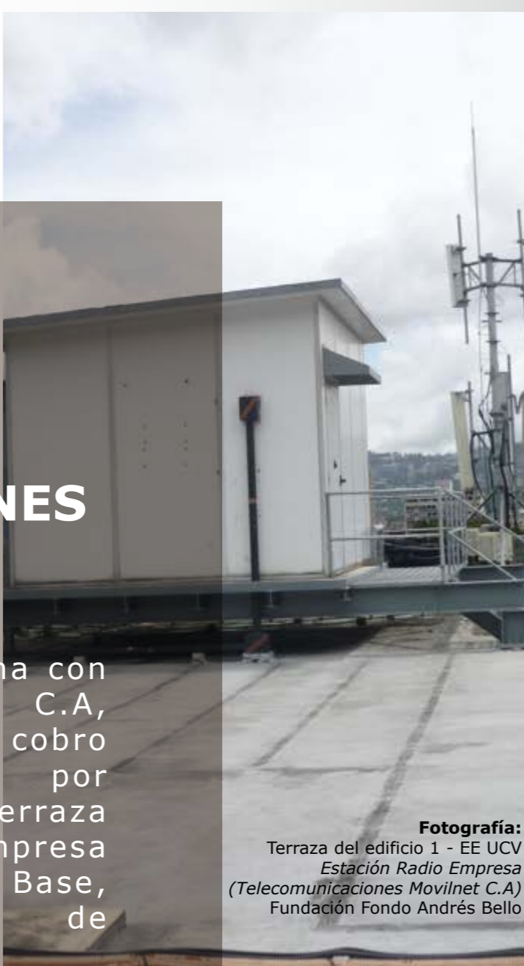
Fotografía: Terraza del edificio 1 - EE UCV Estación Radio Empresa (Telecomunicaciones Movilnet C.A) Fundación Fondo Andrés Bello

La falta de mantenimiento ha causado el deterioro del manto de la terraza, filtraciones en el techo y paredes del aula 1K y baño del piso 4.