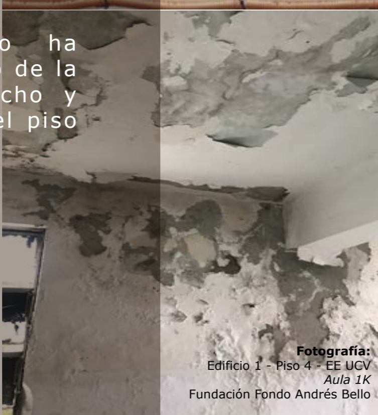
Fotografía: Edificio 1 - Piso 4 - EE UCV Aula 1K Fundación Fondo Andrés Bello

Toda colaboración, conocimiento y participación será siempre bienvenida para alcanzar el desarrollo, rescate y progreso, que nos hemos trazado como meta.