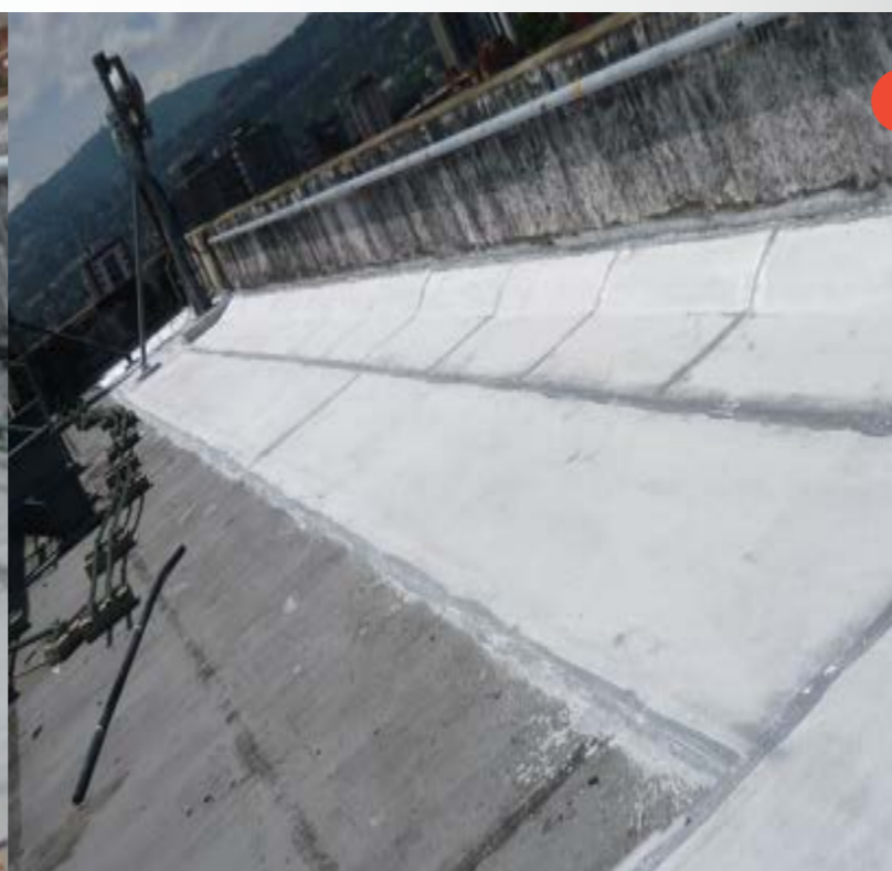
DESPUÉS IMPERMEABILIZACIÓN 2020