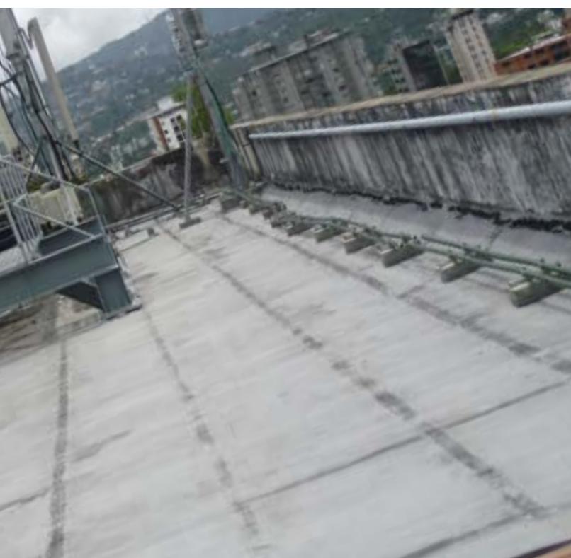
ANTES DESDE EL 2014 NO SE IMPERMEABILIZABA EL ÁREA