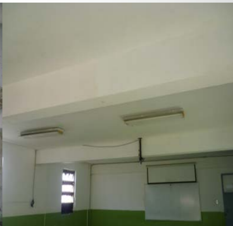
DESPUÉS REFRACCIÓN DE TECHOS 2020