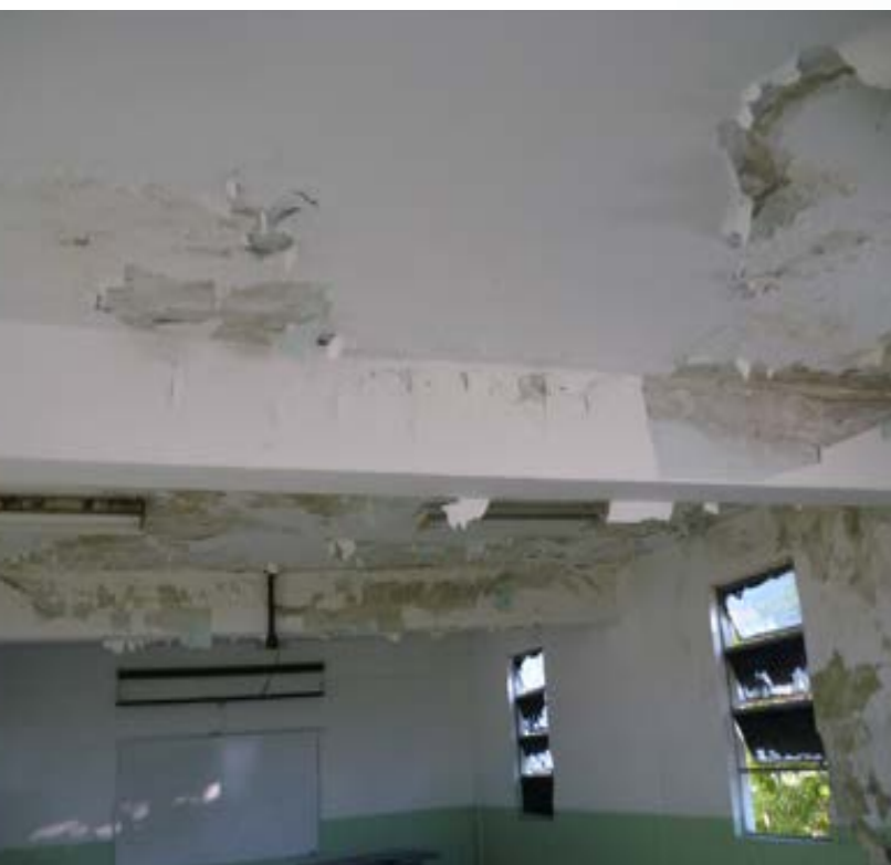
ANTES DETERIORO CAUSADO